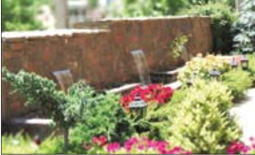
۴-محافظت از گیاهان

فصل پاییز زمان بسیار مناسبی برای کاشت چمن است. ولی باید توجه کرد در موقعیت آب‌وهوایی نسبتاً سرد مانند لواسان، زمانی اقدام به کشت کنیم که حداقل یک چین چمن سربردار می‌شود. فصل پاییز همچنین زمان مناسبی برای لکه‌گیری چمن و کوددهی می‌باشد. بهتر است نسبت به حداقل فصلی یک بار در پاییز یا زمستان، کود دامی کمپلکس پوسیده و سرشنده روی چمن بپاشیم. برای این کار پس از سرند کردن کود، آن را به‌صورت یکپارخت روی چمن می‌پاشیم. به ازای هر ۲۰ مترمربع چمن، یک مترمکعب کود دامی استفاده می‌شود.